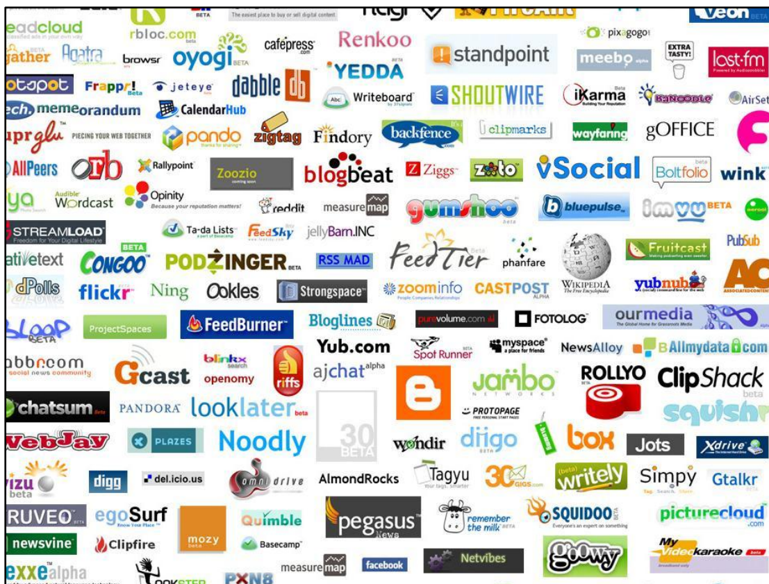
Figur 1: Eksempler på de mange sociale tjenester på nettet.

Sociale Netværks Sider (SNS) varierer meget i målgruppe, formål og de teknologier der tilbydes, og der er mange af dem. Den klassiske definition af et sådant sted er, at det tillader individer: At lave en offentlig eller halv-offentlig profil, at lave en liste over andre brugere, som de har forbindelse til og at få adgang til andres liste over brugere.