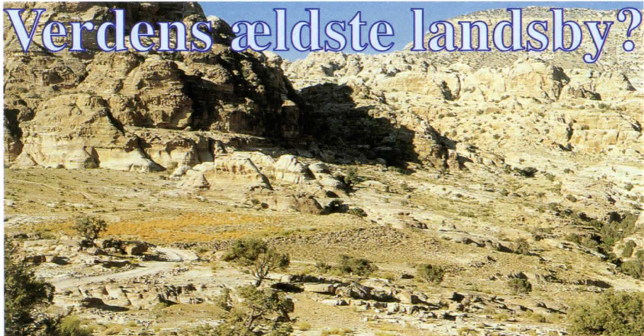
Shaqarat Mazyad set fra syd før selve udgravningen, som foregår i forgrunden af billedet.

En af verdens ældste landsbyer lå tæt på den mystiske oldtidsby Petra i Jordan, hvis fantastiske klippegrave fra tiden omkring Kristi fødsel er kendt viden om. Hvad der er mindre kendt er imidlertid, at Carsten Niebuhr Institutet i København siden 1999 har gravet en 10.000 år gammel landsby frem ved Shaqarat Mazyad 13 km nord for Petra. Med tilfredshed kan udgraverne konstatere, at de nu står med et af verdens ældst kendte eksempler på en komplet plan over et landsbysamfund, måske den eneste. Her er udgravet huse fra den tid, mennesket begyndte at dyrke jorden for første gang, og hvor det at bo i et hus hele året rundt, var en ny måde at leve på.