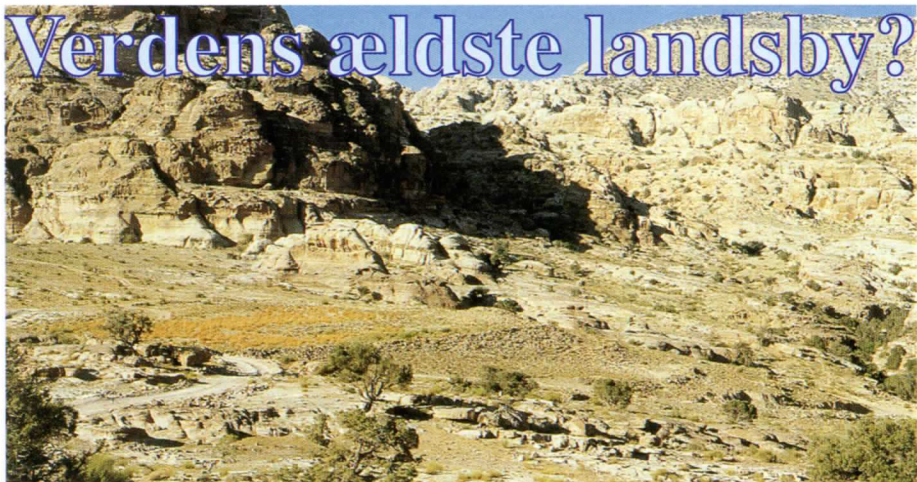
Shaqarat Mazyad set fra syd før selve udgravningen, som foregår i forgrunden af billedet.

En af verdens ældste landsbyer lå tæt på den mystiske oldtidsby Petra i Jordan, hvis fantastiske klippegrave fra tiden omkring Kristi fødsel er kendt viden om. Hvad der er mindre kendt er imidlertid, at Carsten Niebuhr Institutet i København siden 1999 har gravet en 10.000 år gammel landsby frem ved Shaqarat Mazyad 13 km nord for Petra. Med tilfredshed kan udgraverne konstatere, at de nu står med et af verdens ældst kendte eksempler på en komplet plan over et landsbysamfund, måske den eneste. Her er udgravet huse fra den tid, mennesket begyndte at dyrke jorden for første gang, og hvor det at bo i et hus hele året rundt, var en ny måde at leve på.