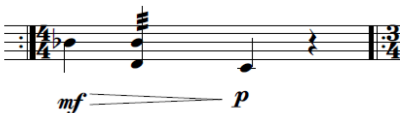
Exemplo 3: compasso 3 (violino)

Outro ponto que chama atenção é a realização do scratch (c. 17) no violino e o que ele representa na obra desse compositor. Por já ter trabalhado com o compositor antes, o violinista sabia a importância de enfatizar esse timbre, como se fosse uma assinatura 2 . A busca foi por ser o mais agressivo e pobre em harmônicos discerníveis, o quanto possível. Em virtude do conhecimento por parte do violinista desta característica da obra do compositor, foi combinado com o violonista nos ensaios a liberdade desse scratch , com uma longa fermata não prevista na partitura, sendo assim encarada como um ponto culminante desse movimento.