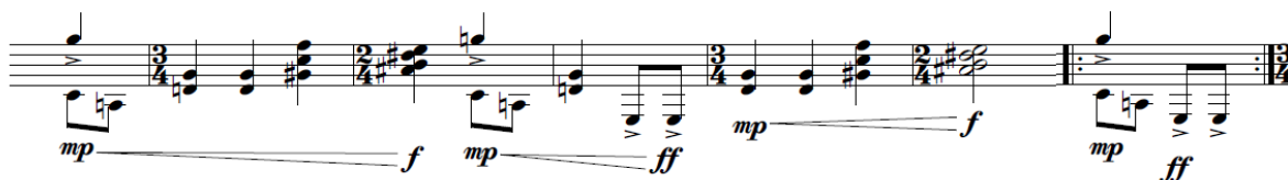
Exemplo 2: trecho entre os compassos 48 e 54 (violão)