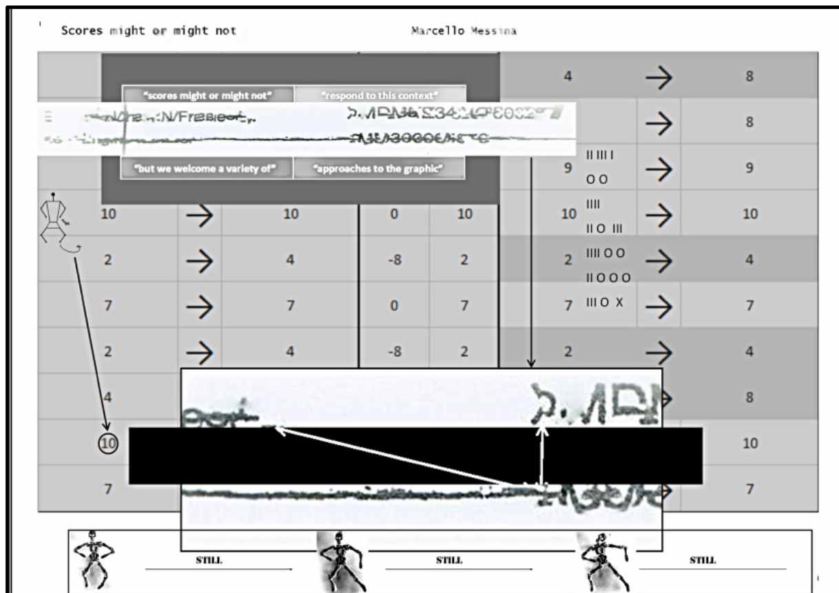
Figura 1: Scores might or might not , página 1

Isso não quer dizer que “qualquer coisa vale” (LISSOVSKY; SIQUERA, 2015). A performance, vista como prática coletiva e negociativa, continua seguindo algum tipo de normas sociais - possivelmente desviantes das parafernália tradicionalmente associadas à sala de concerto (KELLER et al, 2010) e à relação constrangida e coercitiva com o público, mas não por isso menos rigorosas ou atentas (COSTA; BRITO; CIACCHI, 2018). Ao contrário, é a partitura que abdica da sua pressão normativa sobre as ações dos executores, renuncia ao seu status de texto “sagrado” e torna-se exatamente pré-texto, tanto no sentido de constituir apenas uma desculpa para que a música aconteça, quanto no sentido de representar exatamente um prelúdio gráfico ao texto que vai ser continuamente tecido, desfeito e re-tecido através da performance.