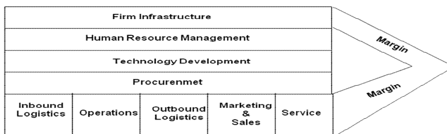
Gambar 2. Value chain & value system.