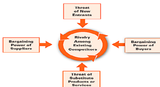
Gambar 1. Five forces: Summary of key drivers

Perusahaan yang sukses adalah perusahaan yang tahu di mana posisi yang relatif menarik dari suatu industri. Mengapa dan bagaimana sebuah industri dapat dikatakan menarik ( attractive position )? Jawabannya adalah perusahaan tersebut memiliki keunggulan kompetitif yang berkelanjutan vis-à-vis berhadapan dengan para pesaingnya. Keunggulan kompetitif terletak pada dua hal ini: biaya yang lebih rendah daripada para pesaing, atau kemampuan melakukan diferensiasi.