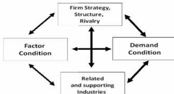
Gambar 3. Determinants of national competitive advantage.

The Diamond yang dikembangkan oleh Porter, juga membicarakan tentang faktor pergerakan individu yang memiliki gagasan (ide) dan berketerampilan tinggi dalam kompetisi global. Faktor-faktor pergerakan (mobile factors) menggambarkan lokasi di mana mereka dapat mencapai produktivitas terbaik, dan keuntungan/pendapatan yang terbaik pula. Teori diamond Porter ini berfokus pada penentu produktivitas, juga menjelaskan daya tarik faktor-faktor pergerakan (mobile) tersebut. Jadi, lingkungan diciptakan melalui usaha saling penguatan kembali (mutual reinforcement) terhadap faktor-faktor yang menentukan.