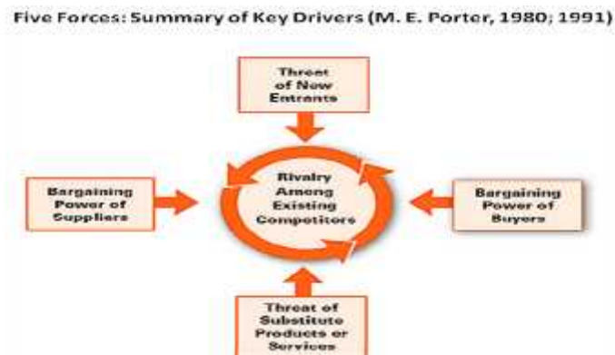
Gambar 1. Five forces: Summary of key drivers

Untuk mendiagnosis struktur industri (lihat, Gambar 1), Porter menawarkan sebuah kerangka kerja (framework) yang ia sebut sebagai lima kunci kekuatan kompetitif. Yakni: (1) pemain baru potensial; (2) pesaing dalam industri; (3) pemasok; (4) substitusi; dan (5) pembeli. Kerangka kerja tersebut dapat diaplikasikan untuk level industri, kelompok strategis (kelompok perusahaan yang memiliki kemiripan strategis), atau bahkan perusahaan individu. Fungsinya pokoknya adalah untuk menjelaskan kebelanjutan perusahaan (keuntungan) dalam persaingan. Struktur industri sebagian dipengaruhi oleh faktor eksogen dan sebagian lagi dipengaruhi oleh tindakan perusahaan. Pemahaman terhadap ruang lingkup perusahaan dan hubungannya dengan struktur industri bermanfaat untuk pembuatan model.