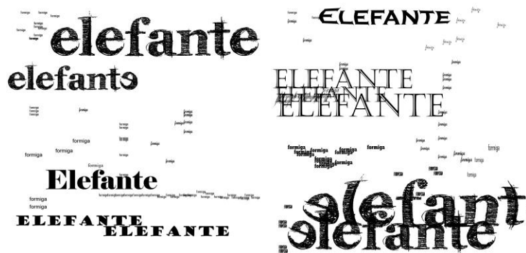
Figura 2. Lara Leal, FormigaELEFANTE, 2010. Partitura Sonora.